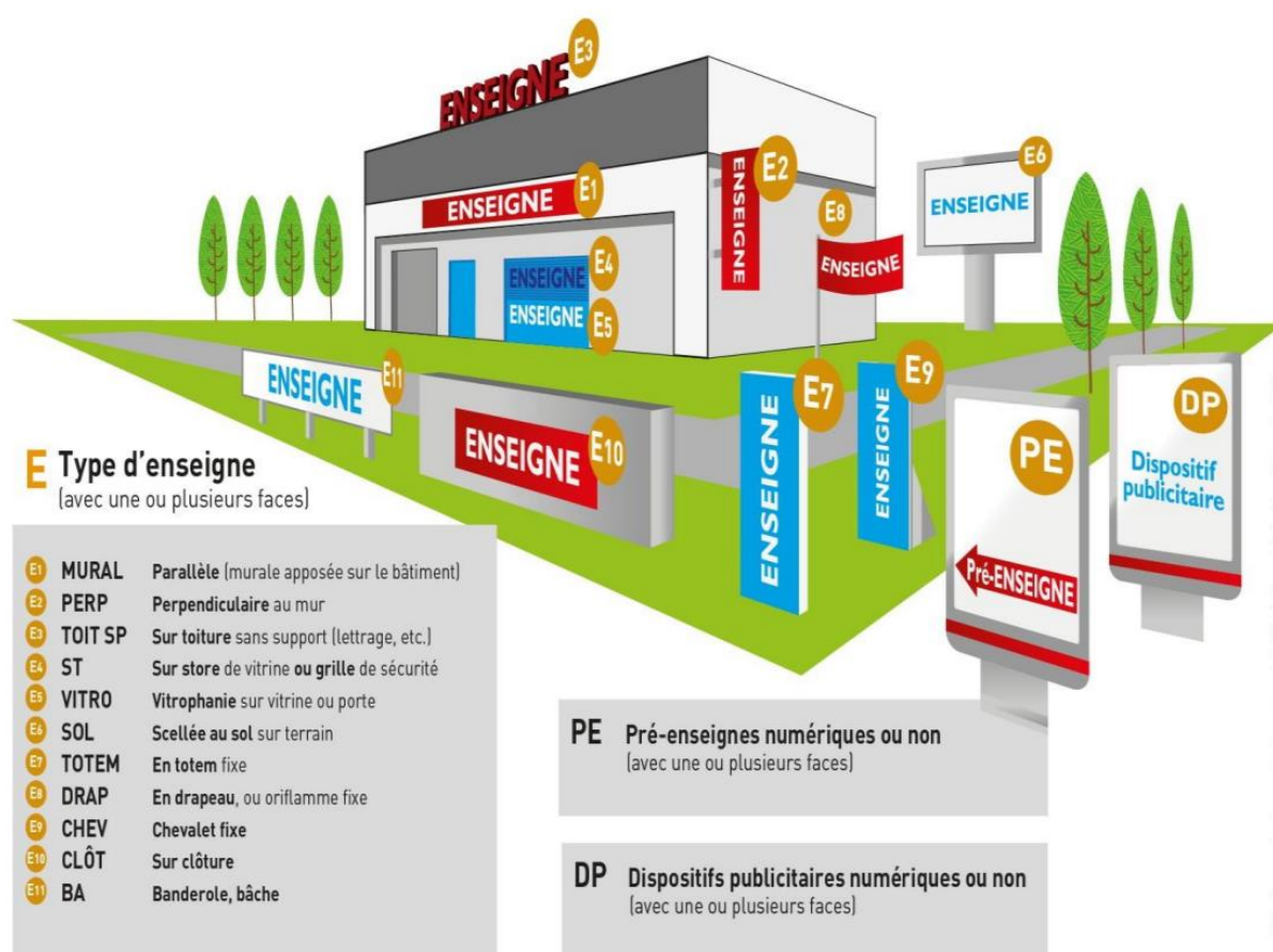
Illustration des types de support taxables (à titre indicatif)

Soit toute inscription, forme ou image indiquant la proximité d'un immeuble où s'exerce une activité déterminée. La préenseigne se distingue de l'enseigne par son lieu d'implantation. La préenseigne est scellée au sol ou apposée sur un immeuble matériellement différent de celui où s'exerce l'activité signalée.